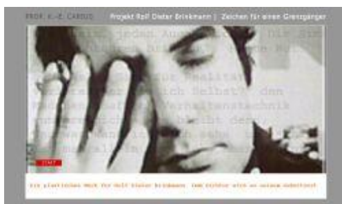
Rolf Dieter Brinkmann, l’homme qui refusa de devenir l’ombre de lui-même.